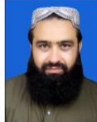
پوهنيار توريالی سنگين د اداره او تجارت خانګې استاد